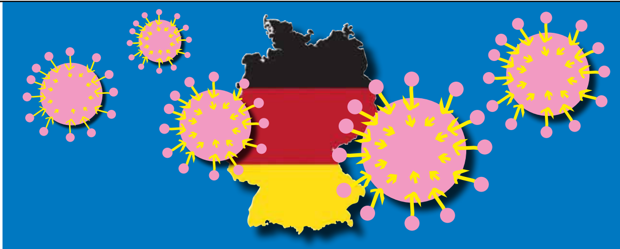
Illustration: Eva Neumann