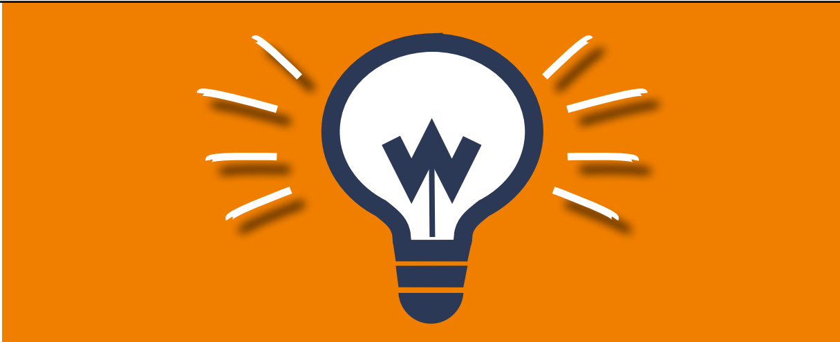
Illustration: Eva Neumann