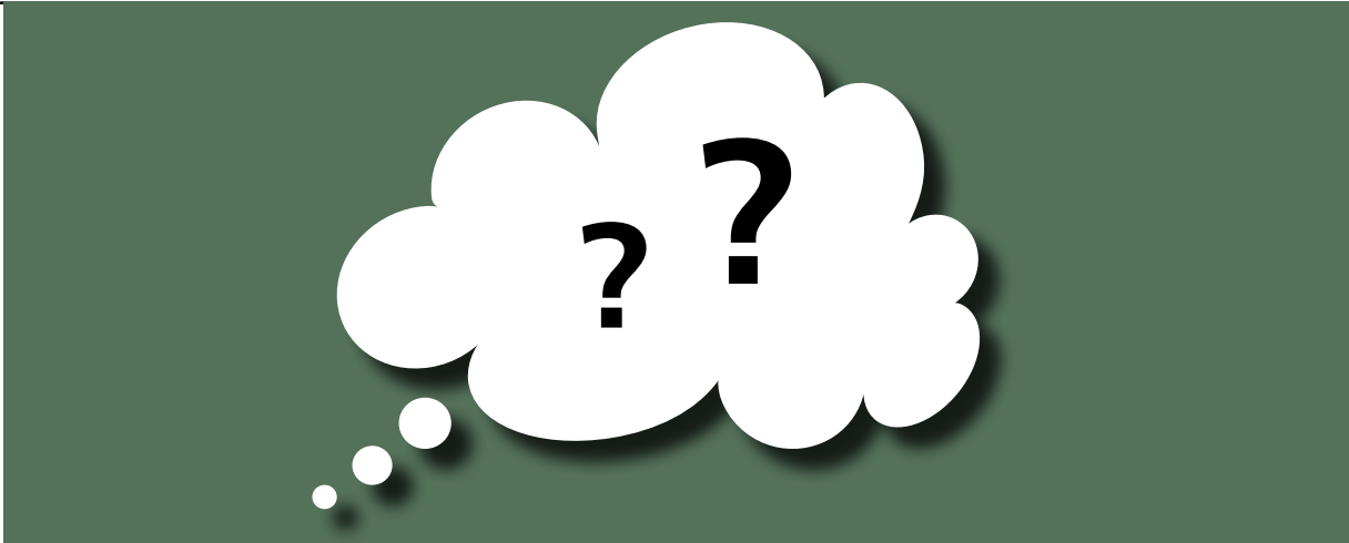
Illustration: Eva Neumann